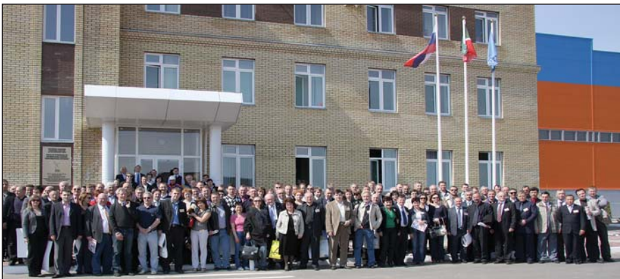
Экскурсии на предприятия вызывают живой интерес не только у коллег-производственников, но и у представителей зарубежных инжиниринговых и машиностроительных компаний, ученых НИИ, преподавателей вузов