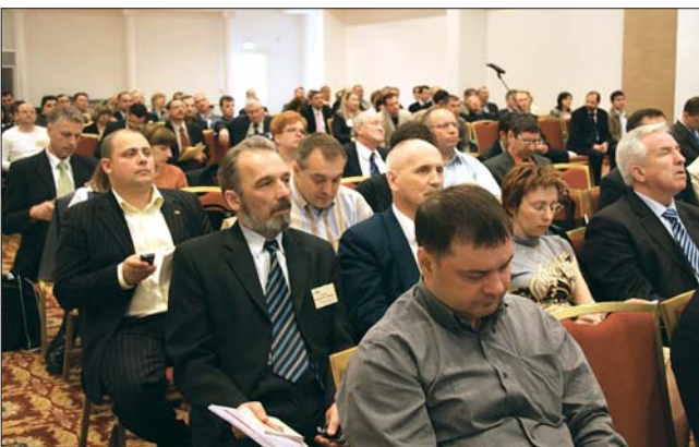
Пленарное заседание. Конференц-зал отеля «Корстон»

Также впервые участвовала в конференции германская фирма «Бартон», более 50 лет занимающаяся разработкой и производством огнеупорных материалов, в том числе и для керамической промышленности и являющаяся одной из ведущих в этом сегменте рынка. В докладе генерального директора М. Варга была представлена новая продукция фирмы – огнеупорный материал BurcoLight. Он представил несколько вариантов футеровки печных вагонеток новым материалом, а также привел технико-экономические результаты оснащения им вагонеток на действующих предприятиях. В частности, на заводе Цлив в Чехии произведена футеровка 48 вагонеток размером 1950×1980×405 мм. На них обжигаются керамические трубы, нагрузка на вагонетку составляет 1200 кг, время прохода вагонетки в печи 22 ч, температура обжига 1280°C. В результате применения материала BurcoLight удалось снизить массу вагонетки на 23,5%, температу-