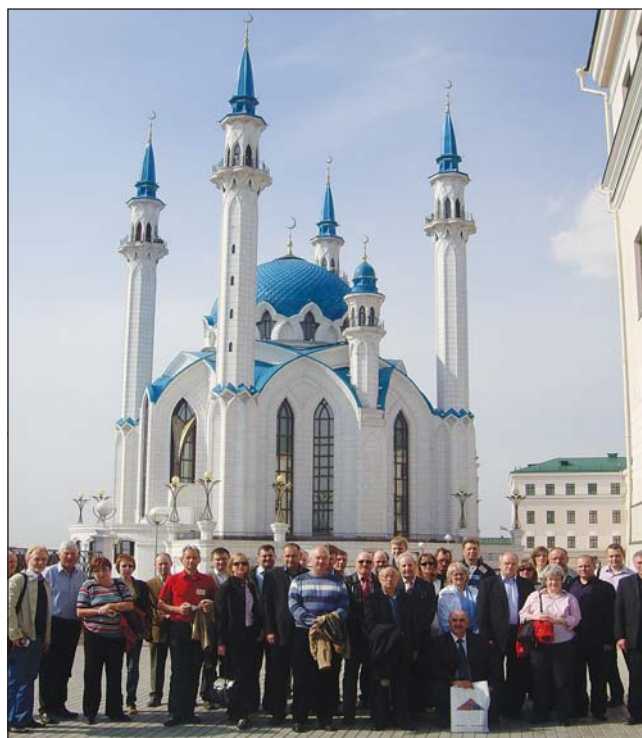
Мы уверены, что отрасль будет развиваться несмотря ни на что, ведь объединение профессионалов гарантирует успех. До встречи на КЕРАМТЭК-2010, друзья!