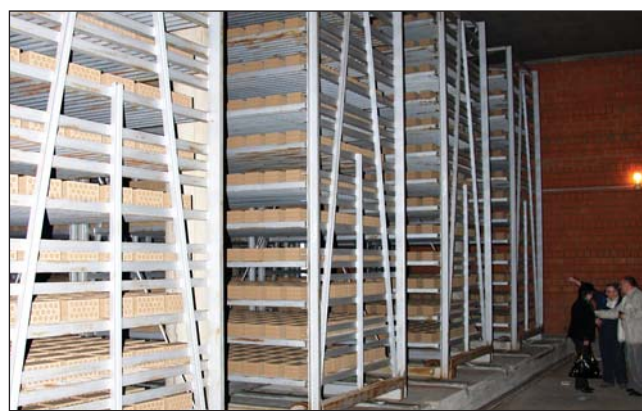
Оснащение сушилки участники конференции смогли осмотреть непосредственно в камере