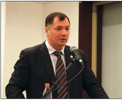
М.Ш. Хуснуллин, Министр строительства, архитектуры и ЖКХ республики Татарстан