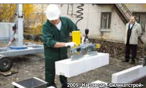
2009. На заводе «Силикатстрой»