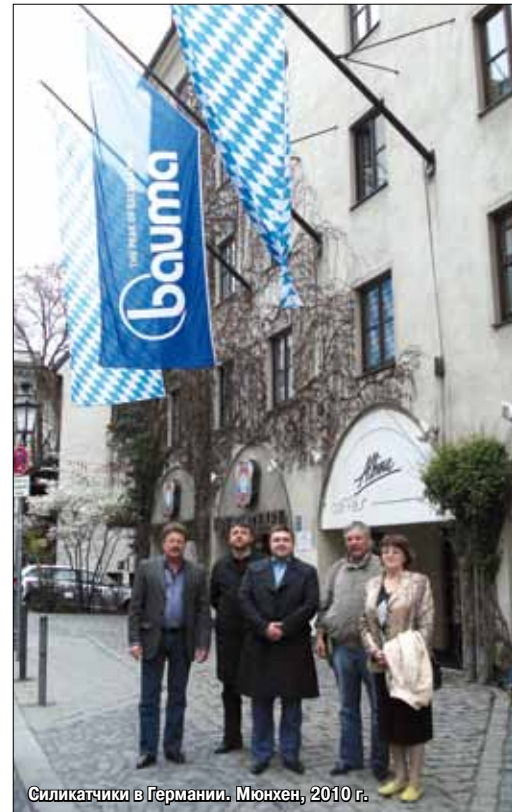
Силикатчики в Германии. Мюнхен, 2010 г.