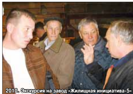
2010. Экскурсия на завод «Жилищная инициатива-5»