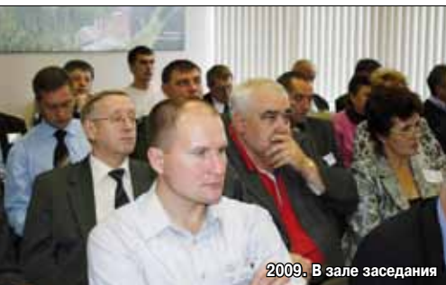
2009. В зале заседания