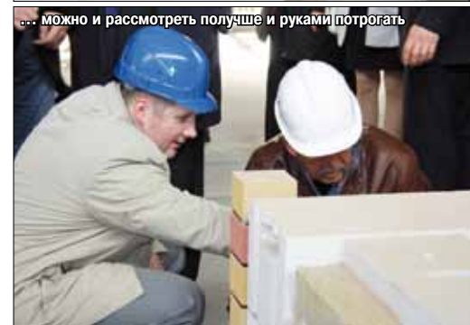
... можно и рассмотреть получше и руками потрогать