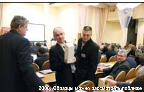
2008. Образцы можно рассмотреть поближе