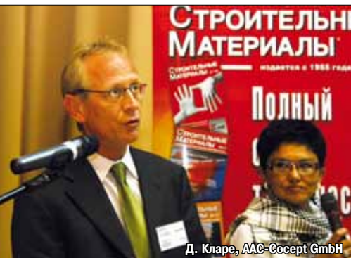
Д. Кларе, AAC-Concept GmbH