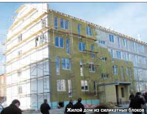
Жилой дом из силикатных блоков