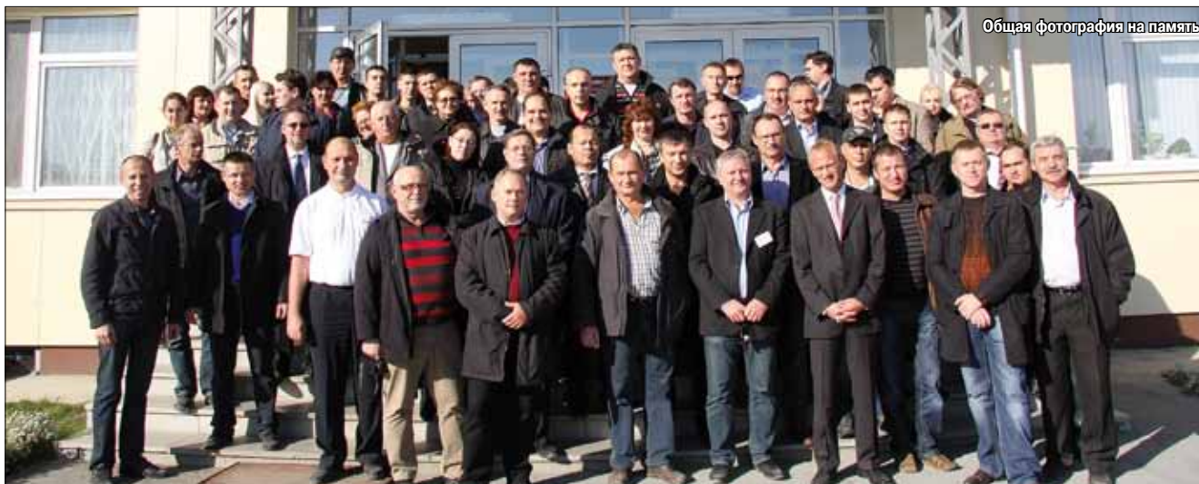
Общая фотография на память