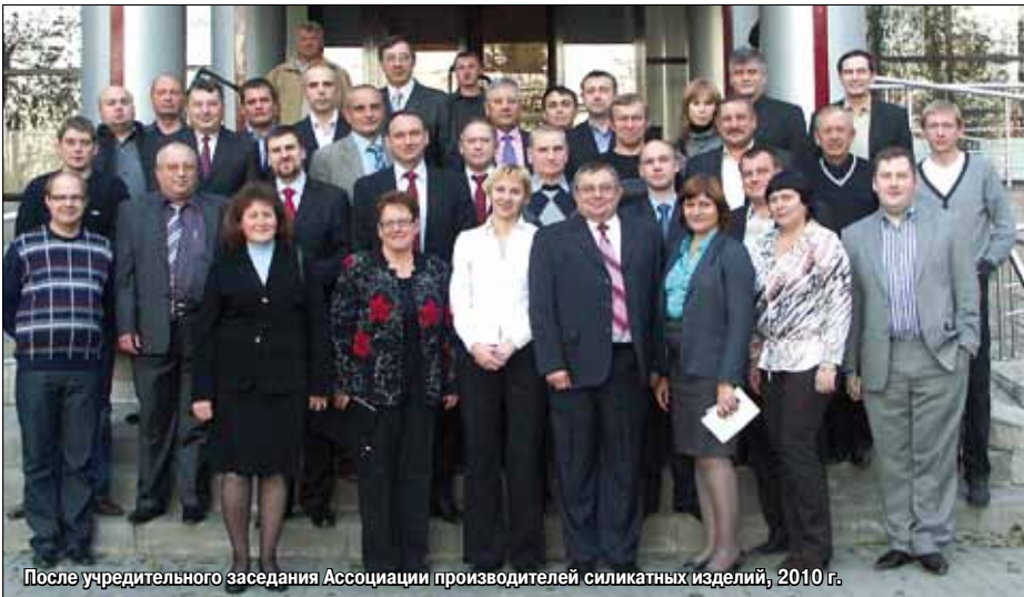
После учредительного заседания Ассоциации производителей силикатных изделий, 2010 г.

ленности, практически перестало существовать, Россию устремились зарубежные производители технологического оборудования. В конференции 2008 г. приняли участие представители машиностроительных фирм из зарубежных стран. Она фактически стала международной. Генеральным спонсором конференции выступила немецкая фирма MASA.