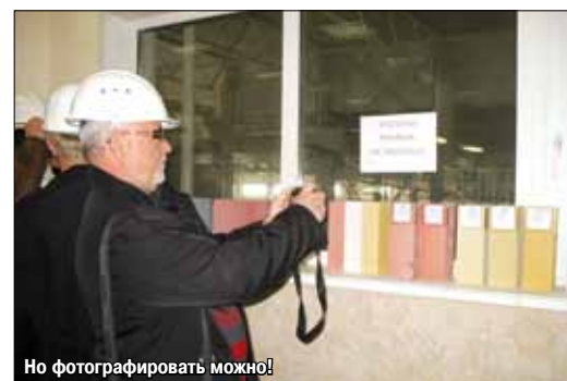
Но фотографировать можно!