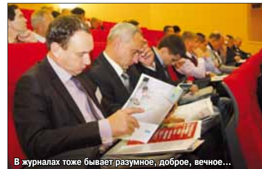
В журналах тоже бывает разумное, доброе, вечное...