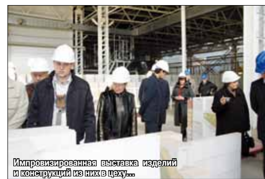
Импровизированная выставка изделий и конструкций из них в цеху...