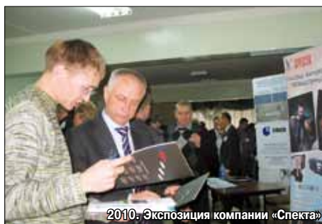
2010. Экспозиция компании «Спектра»