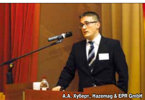
А.А. Хуберт, Hazemag & EPR GmbH