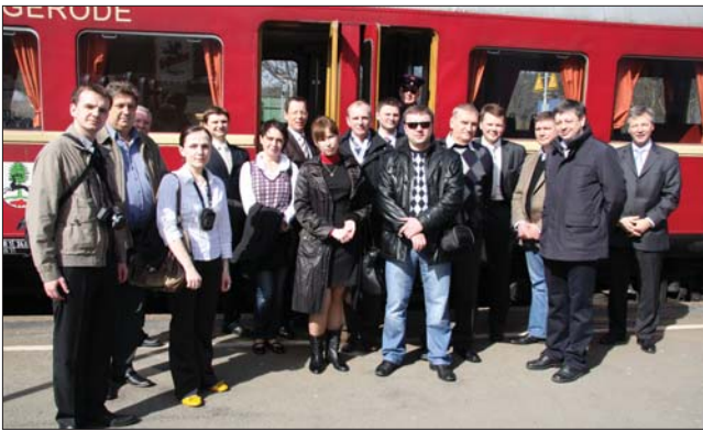
Группа перед историческим поездом