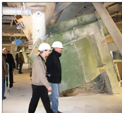
Экскурсия по заводу