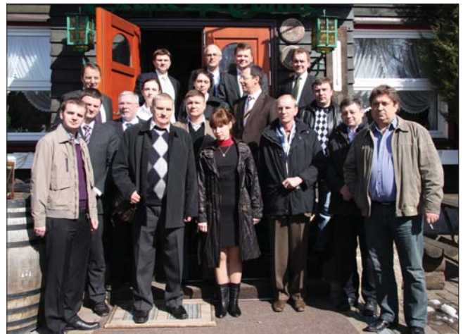
Российские специалисты в горах Гарца