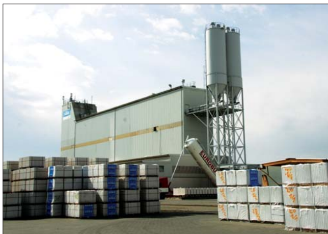
Завод по производству силикатных изделий