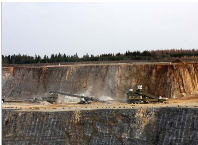
Карьер по добыче известняка