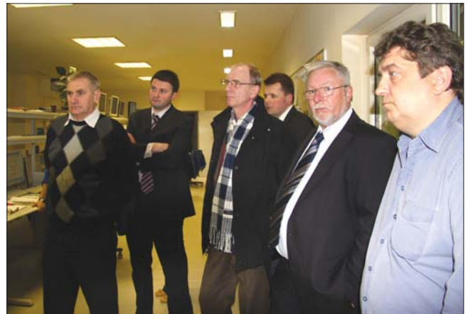
Знакомство с управлением завода Рюбеланд

В заключение участники поездки выразили благодарность организаторам за предоставленную возможность познакомиться с работой заводов фирмы.