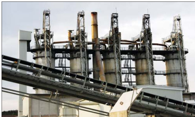
Завод по производству извести Рюбеланд