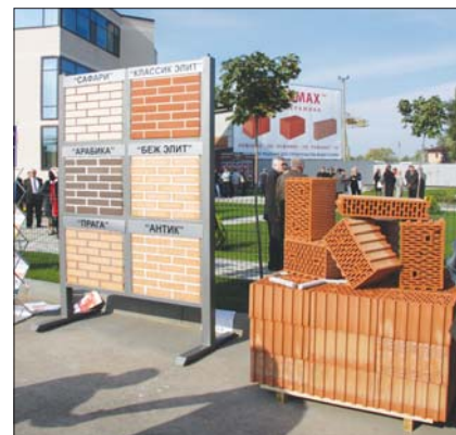
Продукция ОАО «Славянский кирпич»